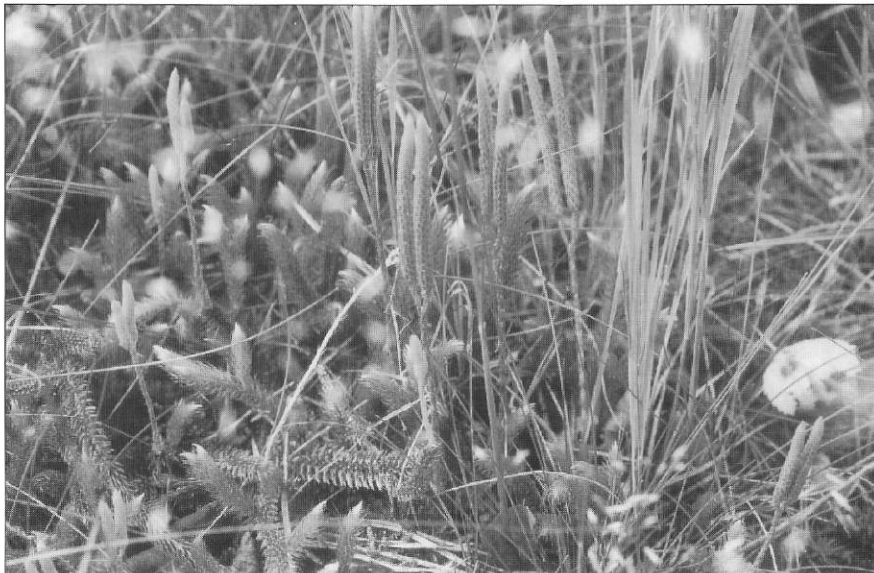
Grote Wolfsklauw met aren

Ten tijde van de excursie was de plant nog niet op z'n mooist (foto boven). De onderste foto is ongeveer anderhalve maand later genomen.