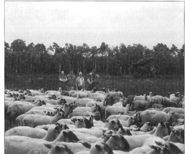
schaapskudde Tongerense hei

Data: 17 januari, 11 april, 23 mei, 11 juli 1998 en 23 januari 1999. Verzamelen op de parkeerplaats aan de weg Vierhouten-Emst, ter hoogte van Gortel.