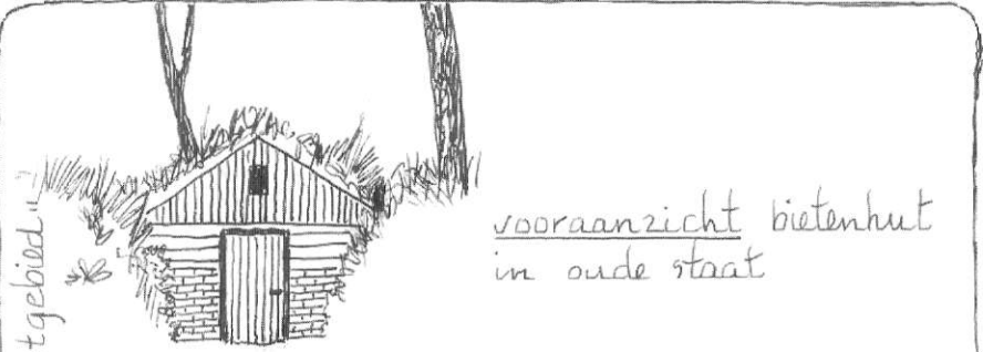
vooraanzicht bietenhut in oude staat

De veeerbietenhut ligt midden in een 12 ha groot "rustgebied".