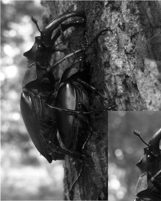
foto 6: Zijn gewei vormige kaken raakten voor zijn poten uit de stam van de boom waardoor ze in een soort hekwerk gevangen zat voor de paring.