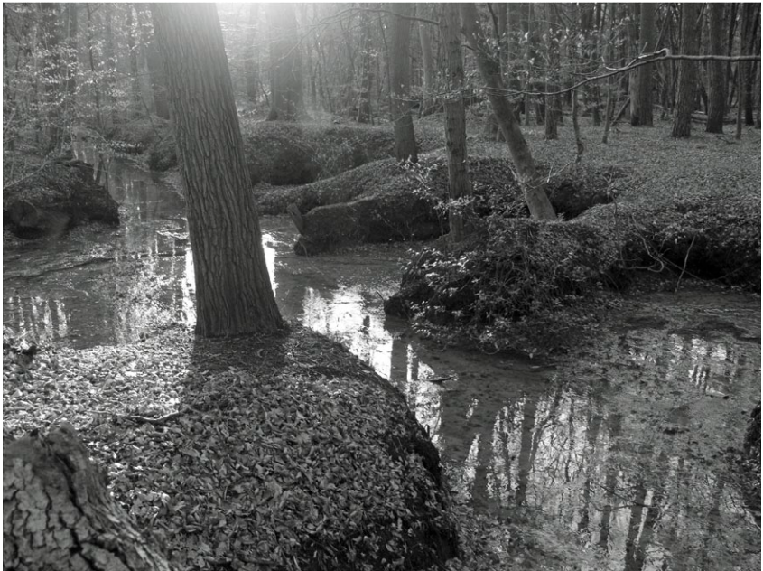
Motketel Elburgerweg. Op onze internetsite www.sbdv.nl staan meerdere foto's en is de ijzerkleur duidelijk waarneembaar.

Toch leidde het arseen wel tot problemen: de wetgeving zag dit als een vorm van bodemverontreiniging, hoe natuurlijk van oorsprong de “vervuilende” stof dan ook was. Dat gaf bijvoorbeeld problemen bij het schoonmaken van sprengen: de ijzeren dus ook arseen houdende sliedlagen die regelmatig verwijderd moeten worden, mochten niet meer, zoals eeuwenlang gebeurde, gewoon op de oevers worden gegooid. Integendeel, ze moesten tegen hoge kosten worden afgevoerd als zwaar verontreinigde grond. Omdat zo iets nauwelijks te betalen is kwam het onderhoud in de knel. ‘Laten liggen waar het ligt’, was jarenlang het devies. Gelukkig is er de laatste jaren veel onderzoek gedaan naar het chemische gedrag van arseen in de bodem. Omdat overduidelijk was gebleken dat het arseen in deze vorm ongevaarlijk is voor de volksgezondheid is men anders gaan denken. Daardoor is de wet- en regelgeving aangepast. Er wordt nu veel meer rekening gehouden met de natuurlijke achtergrondconcentraties. Daardoor is het nu eindelijk mogelijk geworden om beken en sprengen een fatsoenlijke opknapbeurt te geven: de bagger kan in de meeste gevallen gewoon weer op de oevers worden afgezet of op andere manier worden gebruikt.