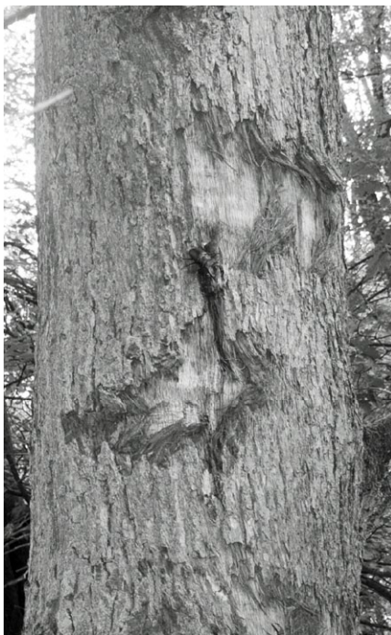
foto 2: een mannetje en een vrouwtje en even daaronder zit nog een kleiner mannetje.

Een paar uur later zag ik drie vliegende herten op een eikenboom zitten. Ze zaten bij een beschadiging van de boom waar suikerrijk vocht uit een wond kwam dat in deze tijd van het jaar in grote hoeveelheden door de bladeren aangemaakt wordt. Het waren een mannetje en een vrouwtje en even daaronder zat nog een kleiner mannetje. Uiteraard ook daar foto's van gemaakt, zie foto 2. De vrouwtjes scheiden geurstoffen af (feromonen) die de mannetjes seksueel prikkelen waardoor de mannelijke vliegende herten de vrouwtjes over grote afstand kunnen lokaliseren. Het kan zijn dat meerdere mannetjes op die feromonen af komen, dan kan er een gevecht tussen de concurrenten ontstaan.