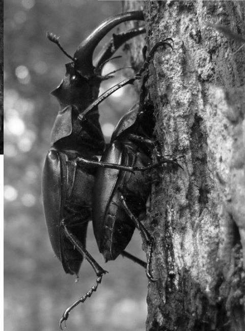
foto 7: Hij doet zijn rechterachterpoot omhoog. Dit heeft niets met urineren te maken maar met een wesp die hij afweerde.

Op foto 7 ziet u dat hij zijn rechterachterpoot omhoog heeft. Dit heeft niets met urineren te maken maar met een wesp die hij afweerde. Onderzoek heeft uitgewezen dat vrouwtjes met hun kaken sap uit de boom opnemen en dit aan de mannetjes voeren tijdens de paring. Door de grote gewei vormige kaken kunnen de mannetjes dit sap zelf niet eten.