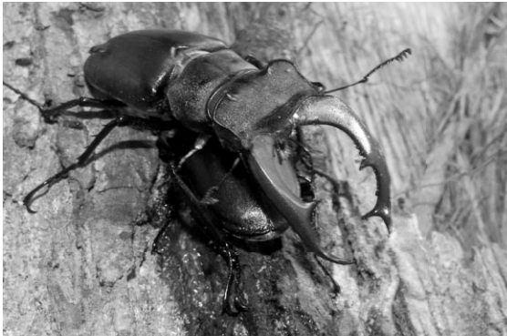
foto 4: Mannetje zit geheel over het vrouwtje heen, wel verkeerd voor een paring.

foto 5: Op een gegeven moment draaide hij voorzichtig en zorgde, met zijn poten over het vrouwtje heen gespreid, dat zij niet weg kon lopen.