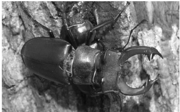
foto 5: Op een gegeven moment draaide hij voorzichtig en zorgde, met zijn poten over het vrouwtje heen gespreid, dat zij niet weg kon lopen.